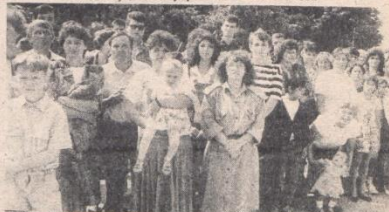
Majke, očevi, sestre, braća, najvjerniji svjedoci rođanja armije i odrastanja sinova