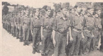
Mladi vojnici u stroju pred trenutak svečanosti