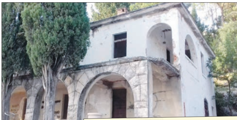
Neum: Nekretnina uz samo morskou obalu procijenjena na 1.859.340 KM

- Nije nam jasno zbog čega je Agencija prošli put poništila poziv. Prigovora je bilo, a mi smo dobili odluke nadležnih sudova, koji su potvrdili da je nekretnina u vlasništvu „BH Pošte“. Iz Agencije su nas