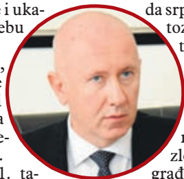
DUNOVIĆ: Novac će se naći

Godine 2011. tadašnji potpredsjednik FBiH iz re-