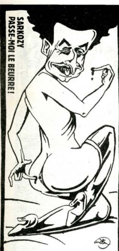
"Dodajte mi maslo", kaže francuski ministar Sarkozy na ovoj karikaturi

je ponovno rođen, ali nakon godinu i pol dana izbile su nesuglasice u redakciji: treba li Berta biti isključivo satirički list ili je valja nadopuniti i ozbiljnim, angažiranim tekstovima? Oni koji su se zalagali za drugu opciju (među njima i glavni urednik) otišli su i osnovali novi tjednik - Kalašnjikov , no ubrzo je Wolinski - vodeći računa o tradiciji - predložio: "Zašto ne Charlie Hebdo ?" I bi tako. A Velika Berta je propala.