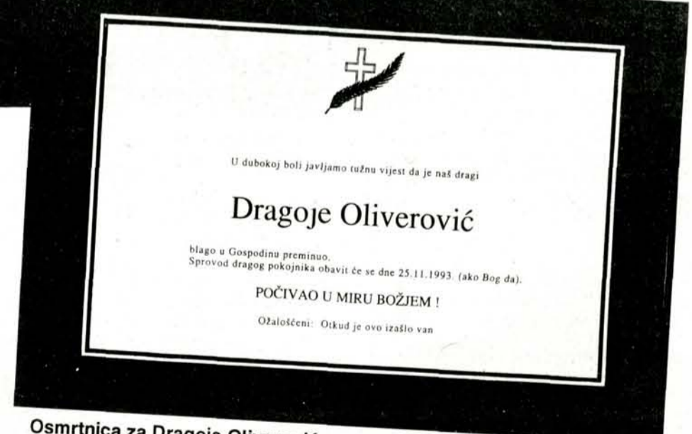
Osmrtnica za Dragoja Oliverovića

Bend "Otkud je ovo izašlo van" nastao je 1992. godine, "na dan rođenja našeg spasitelja", a sama ideja rodila se mnogo ranije: Što se naziva tiče, on je došao sam od sebe i oblik je vođenja (ili bar pretpostavka) kako drugi ljudi gledaju na aktivnosti "Otkud je ovo izašlo van". I sama glazba potpuno je nova za naše podneblje, a dečki misle da je ime benda ionako "ime koje bi im publika sačuvala, pa stoga i najprimjerenije".