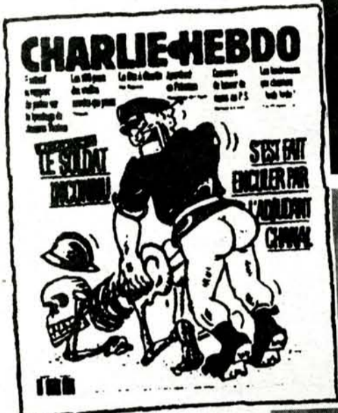
Naslovna stranica Charlie Hebdo , posvećena Neznanom junaku, koja je uzburkala francuske vojne krugove

bio je to veliki skandal u Francuskoj. Jedan je bojničnik silovao vojnika te se ovaj samoubio. No još veće zgražanje nastalo je kada je tamošnji satirički tjednik Charlie Hebdo na svoj poslovično radikalni način, karikaturom na naslovnoj stranici, komentirao pokušaj zataškavanja toga slučaja: "časnik" guzi kostur označen natpisom - Neznan junak. Institucija Neznanog junaka u Francuskoj poprilična je svetinja, pa se jedna vojnička udruga osjetila dovoljno pogođenom da podigne tužbu protiv lista, a ministar obrane François Leotard osobno je poslao prosvjed glavnom uredniku. Došlo je tako do tipične zamjene uzroka i posljedice, nama ovdje tako poznate, kada se diže veća povika na glasnika o zločinu negoli na samog zločinca. Sudski proces zbog Charlie ve karikature - prema kojoj su Feral ovi prizori iz bračnog života Tudmana i Miloševića tek nevini softcore - upravo je u tijeku, paralelno s još pet sličnih tužakanja protiv ovoga tjednika čija je naklada 50.000 primjaka koje, prema procjenama redakcije, pročita oko 250.000 čitatelja. To je i za veliku Francusku prilično krupan medijski utjecaj, inače se nitko ne bi uzbuđivao. Sami članovi redakcije ne brinu zbog ovih zapleta u sudnici, imaju - kažu - izvrsnog odvjetnika, a i prilike su drugačije nego u doba kada su tužbe dovele do prestanka izlaska lista krajem sedamdesetih godina.