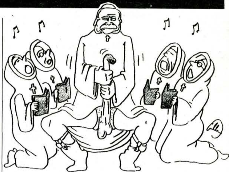
"Vatikan je za mušku masturbaciju", piše uz ovu Charlie vu karikaturu

moubilačkog lista bili su takvi velikani karikature kao Wolinski , Siné ili pokojni Reiser kojega je kod nas proslavilo redovito prenošenje na Poletovim stranicama. Prva dvojica još uvijek objavljuju u Charlieu .